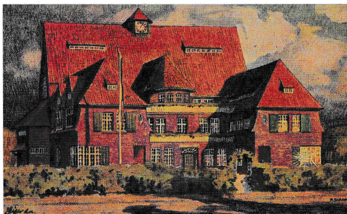
Bild oben: historische Postkarte des Soldatenheims, Bild links: Hier entsteht der Festsaal